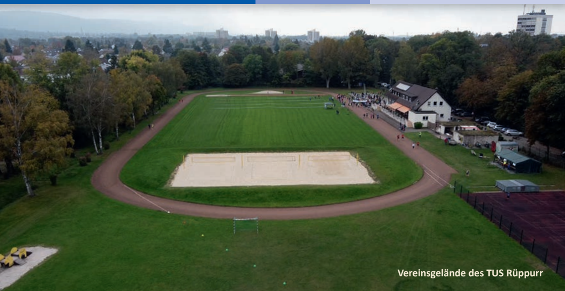
Vereinsgelände des TUS Rüppurr