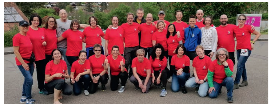
Teilnehmer*innen im Finisher-Shirt