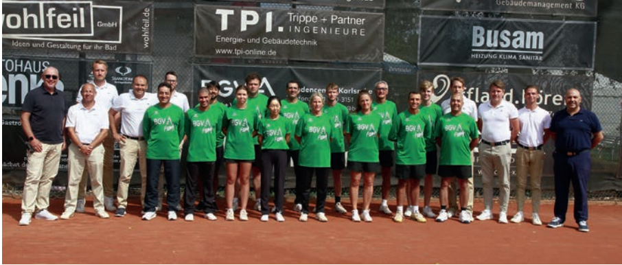
TENNIS OPEN KARLSRUHE 2023 auf dem Gelände des TCR