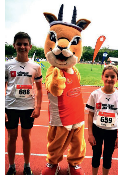
Impressionen der Langen Laufnacht und des Hänsel+Gretel-Kinderspendenlaufs