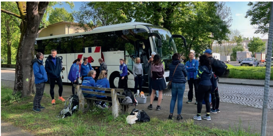
Treffpunkt am Bus

Halbmarathonis und Viertelmarathonläufer wieder aufeinander, sodass bei Klängen einer Dudelsackgruppe eine große Schar von LäuferInnen gemeinsam den leckeren Wein genießen konnte. Weiterhin ist zu erwähnen, dass viele Teilnehmer mit farbenfrohen Kostümen auf der Strecke unterwegs waren und das Laufergebnis beim ein oder anderen nicht ganz im Vordergrund stand. Nach einem ereignisreichen Lauf und anschließender Stärkung in einer Pizzeria machte sich die Gruppe abends beschwingt und gutgelaunt auf den Heimweg nach Karlsruhe. Andreas Hülsheger