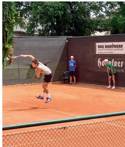
Beim ATP-Challenger Turnier 2023 ▶

von Karlsruher Tennisvereinen traten auf sechs Kleinfeldern gegeneinander an und trugen voller Stolz die vom BGV gesponserten blauen Trikots. Beim Anblick der engagierten Betreuer und den motivierten Tenniskinder muss man sich zumindest bei anderen Karlsruher Tennisvereinen keine Sorgen um den Nachwuchs machen. Nun standen am Samstag ab 16 Uhr die beiden Halbfinalspiele an. Diese waren für mich eigentlich die besten Spiele des ganzen Turniers. Man spürte den Willen der Spieler, unbedingt ins Finale zu kom-