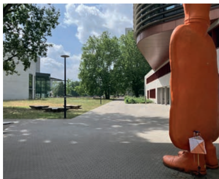
Kontrollposten auf dem KIT-Campus (Martin Schwarz)