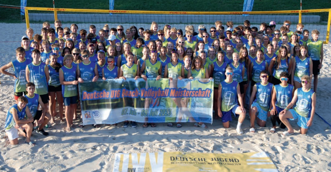
Gruppenbild aller Teilnehmenden

en, die der Deutsche Volleyballverband für die Durchführung der DM aufstellt. Deshalb wollten wir uns die Gelegenheit nicht entgehen lassen und uns direkt im ersten Jahr an so ein Event wagen und testen, ob wir dieser Herausforderung gewachsen sind. Die Vorbereitungen auf das Turnier liefen seit dem Zuschlag im Januar. Um allen Spieler*innen ein unvergessliches Erlebnis zu bescheren, mussten zahlreiche Dinge bedacht und organisiert werden. Vom Aufbau der (teilweise noch zu beschaffenden) Zelte, über Stromversorgung für die gesamte Anlage, Anmietung einer Tribüne und zusätzlicher Toiletten, Aufbau eines Gerüsts für die Liveübertragung, Organisation von Ausrüstung und Technik für Musik und Turnierleitung, Bestellung von Shirts für alle Spieler*innen und Helfer*innen, Suche von Sponsoren, bis hin zu Kühlmöglichkeiten für Speisen und Getränke; für zahlreiche Probleme mussten zum Teil sehr kurzfristig pragmatische Lösungen gefunden werden.