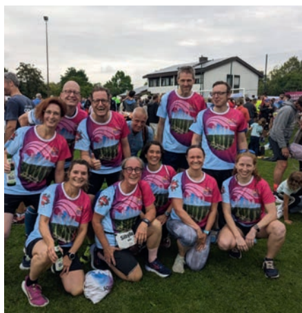
Impressionen 24-h-Lauf und Bergdorfmeile