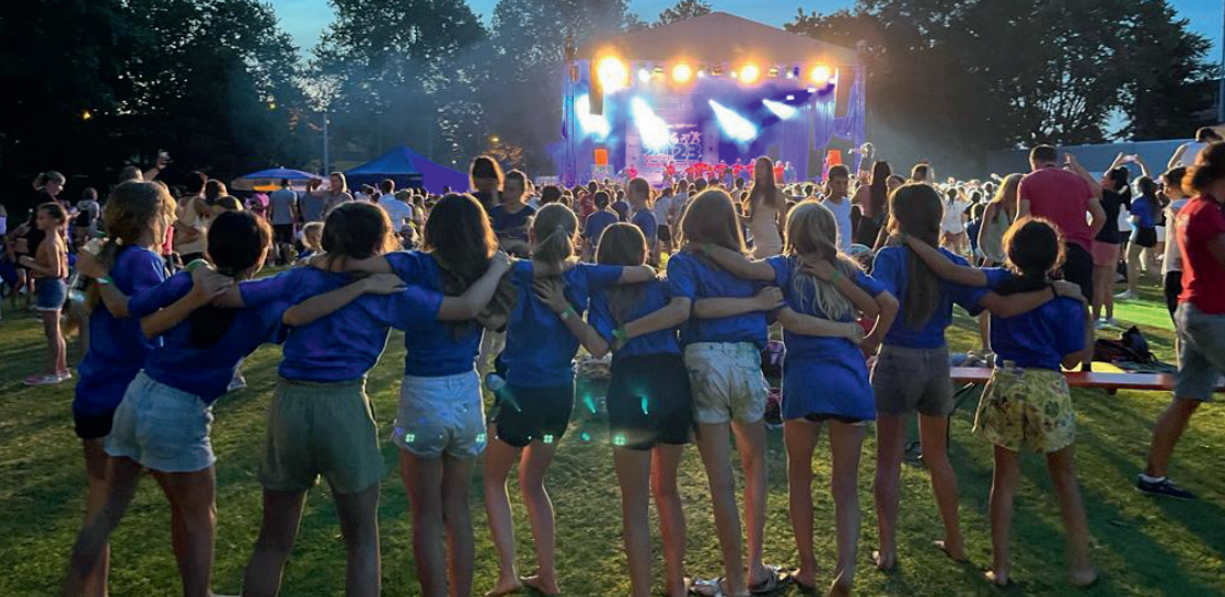
Die Kinderparty auf dem Festgelände

Mittags stand dann als Nächstes der Staffellauf an. Und unsere Minis konnten tatsächlich mit den älteren Mädels mithalten und erhielten 8,45 Punkte. Ein gutes Ergebnis. Als Letztes war dann der Ballweitwurf an der Reihe. Und hier zeigte sich natürlich, dass man mit zehn und elf Jahren noch nicht so weit werfen kann wie die 13- und 14-jährigen Mädels. Mit 6,45 Punkten erreichten die Mädels aber ihr Trainingsziel. Um 14.30 Uhr war der Wettkampf beendet und alle waren zufrieden und glücklich. Abends konnten unsere Minis dann bei der Kinderparty auf dem Festgelände einen gelungenen Wettkampftag feiern und hatten viel Spaß. Am Sonntag fand dann die Siegerehrung auf der Turnfestbühne statt. Unsere Minis durften hier im Rahmen der Show der Sieger nochmals ihren Tanz vorführen und sich über einen hervorragenden dritten Platz freuen. Wir sind alle sehr stolz auf unsere Minis! Das habt Ihr super gemacht. UBH