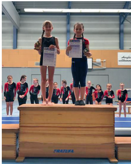
Eindrücke des Turn10® Einzelwettkampfs in Miesau