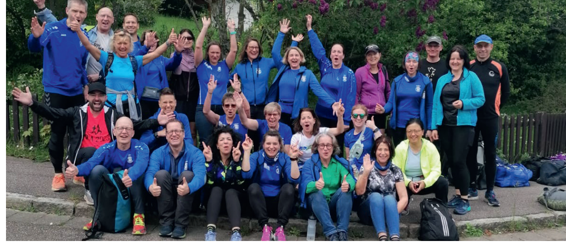
Vor dem Start

Aktuelle News und Mitteilungen der Leichtathletik-Abteilung finden Sie im Internet unter www.tus-rueppurr.de/abteilungen/leichtathletik