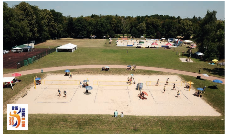
Luftaufnahme unserer schönen Beachvolleyballanlage

Erweiterung unserer Beachanlage, die nun mit neun Feldern auch die größte Anlage in Baden-Württemberg ist, haben wir nicht nur ideale Bedingungen für Beachturniere und -camps aller Art. Wir erfüllen damit auch die Minimalkriteri-