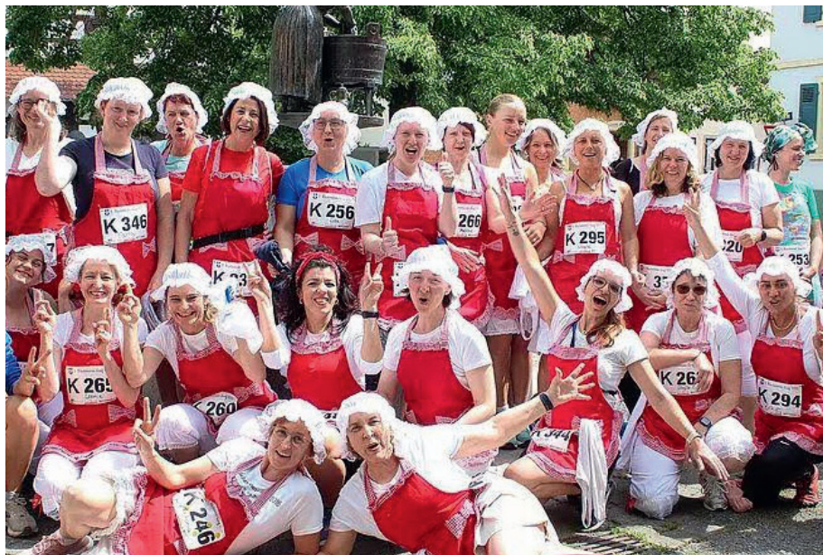
Gruppenfoto beim Wäscherinnenlauf 2023

sein. Übriges zum Gelingen des Sportfestes, bei dem die männliche Begleitung schon früh den kalten Hopfengetränken zusprach. Leckeres Bier, schäumender Sekt, eine Grillwurst oder ein Burger stellten die kulinarische Herausforderung zuerst für die Begleitung und später nach dem Zieleinlauf für die Läuferinnen dar. So bleibt der sechste Wäscherinnenlauf als einer der ersten warmen Tage in Erinnerung inklusive sportlicher Kostümlauf-Gaudi, die einige Nicht-Rüppurrerinnen bierernst sogar für kämpferische Bestzeiten nutzten. Aber insgesamt überwiegen im Rückblick die Bilder vom gemeinsamen Feiern einer schönen Sportveranstaltung, zu der sicherlich 2024 erneut jede Menge TUS-Frauen an den Start gehen werden. Christian Flier