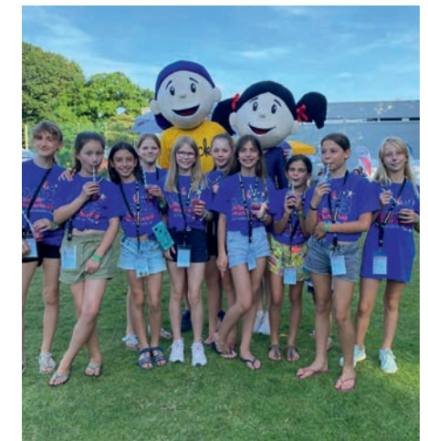
Die Mädels mit den Maskottchen Minchen und Muck.

belohnt. Das war die beste Turnwertung des ganzen Tages. Aufgrund dieser hervorragenden Leistungen hatten sie es tatsächlich geschafft, nach zwei Disziplinen zu führen. Und das vor den älteren Konkurrentinnen. Das war super!