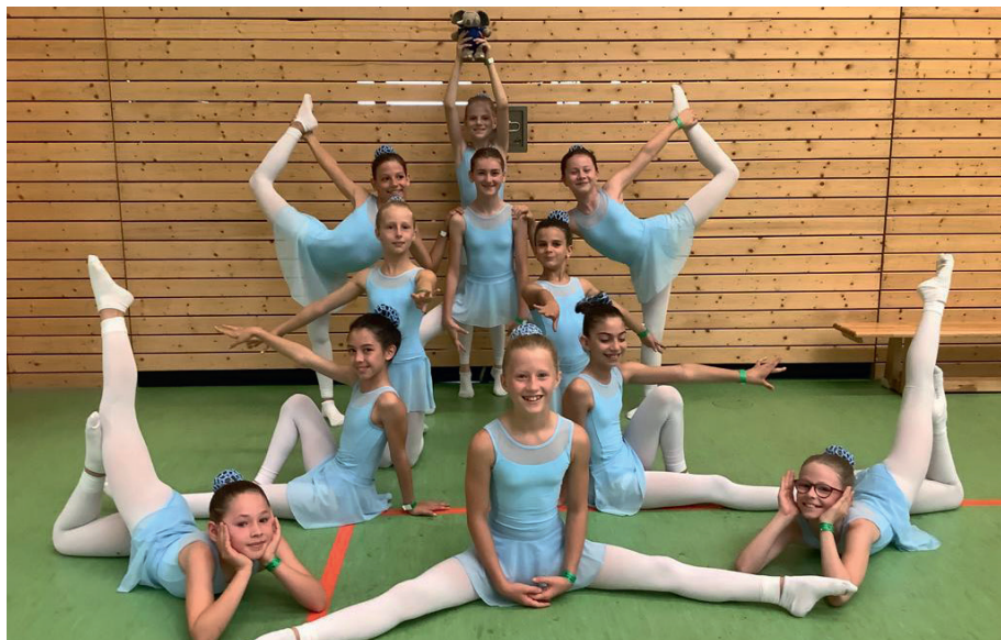
Unsere Mädels in ihrem Tanzoutfit