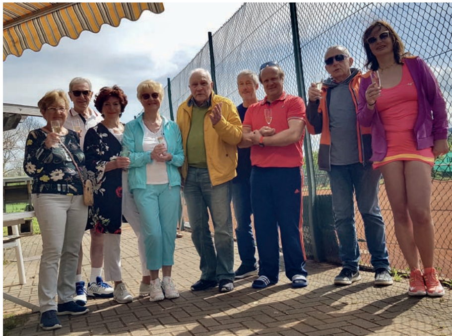
Die Saison kann starten ...

sich je zwei Damen- und Herren-Doppel. Nach der langen Winterpause war es eine Umstellung, wieder Sand unter den Füßen zu spüren. Technik und Taktik waren zwar noch nicht bei allen formvollendet, aber Spaß hat es allemal gemacht.