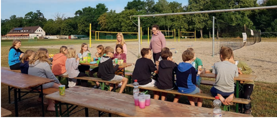
Pause muss auch mal sein.

Wechsel der Altersklassen verändert. Nur eine Konstante und ein echtes Highlight darf natürlich nicht fehlen: Unser Beachcamp. An zwei Abenden (einmal bis zur U 14 und einmal ab U 16) laden die Trainer*innen die Kids inkl. Eltern und meist auch einige Geschwister zum Grillen, Sitzen, Quatschen und nebenbei auch Spielen ein. Die Gelegenheit zum Austausch wird immer sehr gut angenommen und ist bei allen ein beliebter Termin, weil ausnahmsweise nicht der Sport und der Verein im Vordergrund steht. Die Kinder nutzen meist trotzdem