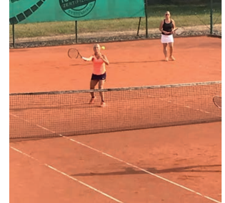
Damen 40 bei der Medenrunde im Sommer 2023